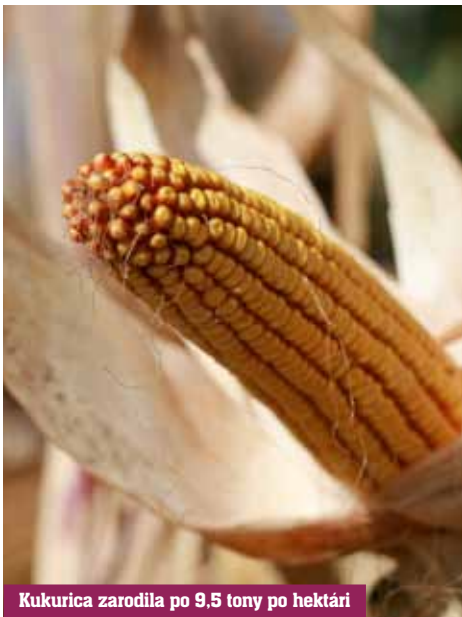
Kukurica zarodila po 9,5 tony po hektári

Ten, kto pozná svetové poľnohospodárstvo, vidí ako práve rentabilita toho či onoho poľnohospodárskeho produktu, ale aj konkrétna štátna a dnes najmä Spoločná poľnohospodárska politika EÚ ovplyvňuje charakter hospodárenia. Práve tieto dva faktory nadiktovali orientáciu PD Podhájska-Radava na pestovanie obilnín, kukurice a olejní.