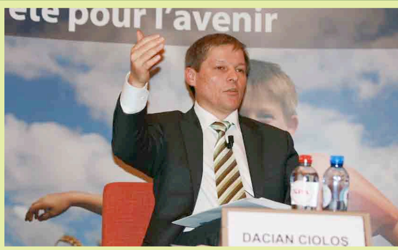
Dacian Ciolos - eurokomisár pre poľnohospodárstvo a rozvoj vidieka “ Dúfam, že koncom júna dôjde k politickej dohode.