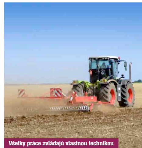
Všetky práce zvládajú vlastnou technikou