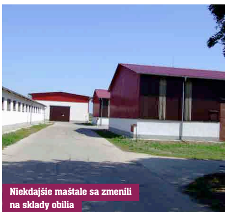
Niekdajšie maštale sa zmenili na sklady obilia

V roku 1992 sa všetko zmenilo a od roku 2006 je podielníckym družstvom. Kým predtým sa zaoberalo najrôznejšími aktivitami, okrem rastlinnej a živočíšnej výroby aj pridruženou výrobou, ako bolo vtedy zvykom, v nových podmienkach sa uskutočnila transformácia, ktorá preverila efektivitu každého úseku. Výsledkom je nielen skutočnosť, že sa podnik zbavil všetkých neefektívnych prevádzok a zoštíhlil sa na 38 pracovníkov. „ Tí tvoria kolektív “, hovorí výkonný riaditeľ