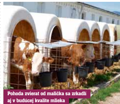
Pohoda zvierat od malička sa zrkadlí aj v budúcej kvalite mlieka

Dobré zhodnocovanie plodín umožňuje v prašickom družstve diverzifikovaný odbyt. Rozhodujúcu časť repky predávajú cez spoločnosť Poľnoslužby Rybany, kde sa vytvára priestor na to, aby jej sedem akcionárov dosiahlo maximálnu trhovú hodnotu repky. Pri hustosiatych obilninách postavili prašickí družstevníci odbytovú filozofiu tak, že značná