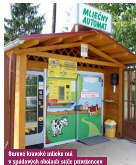
Surové kravské mlieko má v spádových obciach stále prívrecov