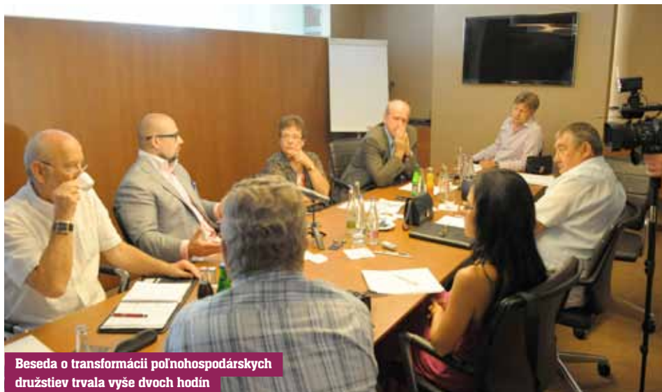
Beseda o transformácii poľnohospodárskych družstiev trvala vyše dvoch hodín

Podľa mňa sa transformácia na Slovensku de jure skončila. Netreba už žiadnu legislatívnu úpravu. De facto však v mnohých družstvách nespĺnila svoje ciele. A tak ako vznikla skrivodlivosť v 50-tych rokoch pri združstevňovaní, keď ľudia prišli o majetky, keď ich povinne vkladali do družstiev, tak vzniklo veľa skrivodlivosti aj pri transformácii, ktorá sledovala navrátenie majetku tým ľuďom. Obávam sa, že nie je ani možné skrivodlivosť nejakým spôsobom napraviť. Samotná budúcnosť družstiev je však v rukách manažmentu a samozrejme aj vlastníkov majetku, ktorí sú členmi družstva. Tí by mali brať ohľad aj na vlastníkov DPL. Pokiaľ sa chcú stať členmi družstva, mali by im to umožniť, aby aspoň z časti bola táto skrivodlivosť napravená.