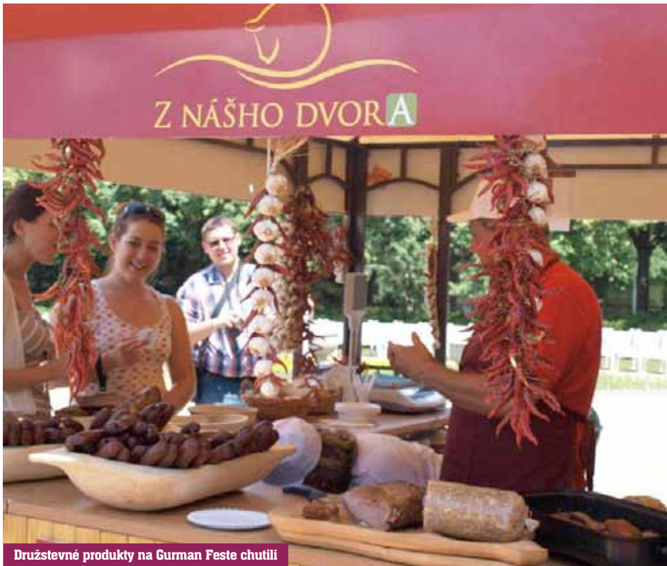
Družstevné produkty na Gurmán Feste chutili