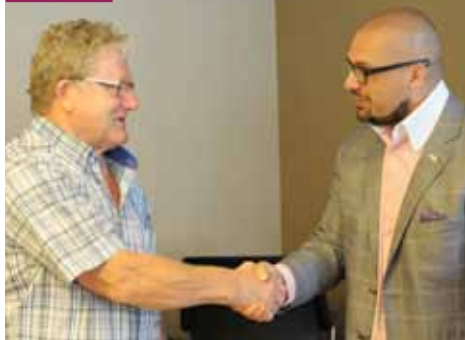
Po zvitaní sa hostí sa navzájom sa rozprúdila výmena názorov na dvadsaťročnú transformáciu družstiev