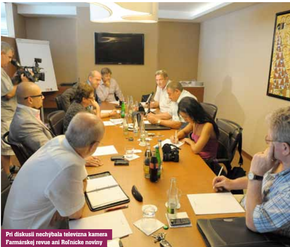
Pri diskusií nechýbala televízna kamera Farmárskej revue ani Roľníckej noviny

J. Urminský: Pokiaľ získal štát prostredníctvom Fondu národného majetku kapitálovú účasť v družstvách tak, že niektorí podielníci družstiev mu odovzdali svoje DPL, to nie je meritom veci. Je to iba dôsledok skratového správania sa a chýb tých manažérov družstiev, ktorí to dopustili. Podľa mňa je slabým manažérom ten, ktorý dopustí, aby