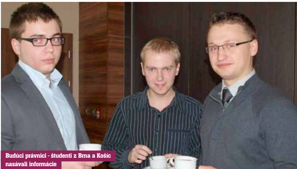
Budúci právnici - študenti z Brna a Košíc nasávali informácie