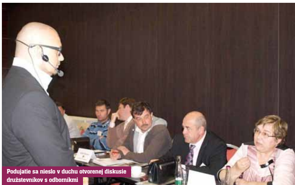
Podujatie sa nieslo v duchu otvorenej diskusie družstevníkov s odborníkmi