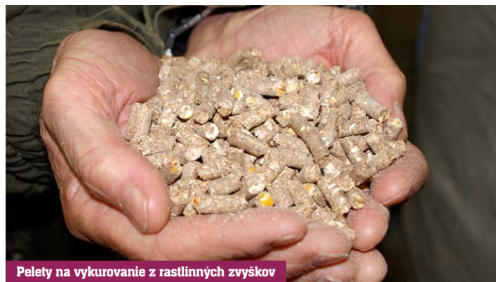
Pelety na vykurovanie z rastlinných zvyškov

“ Základom úspechu v podnikaní na pôde je poriadok, disciplína, rozvaha, pevná vôľa, väšeň a radosť z práce. ”