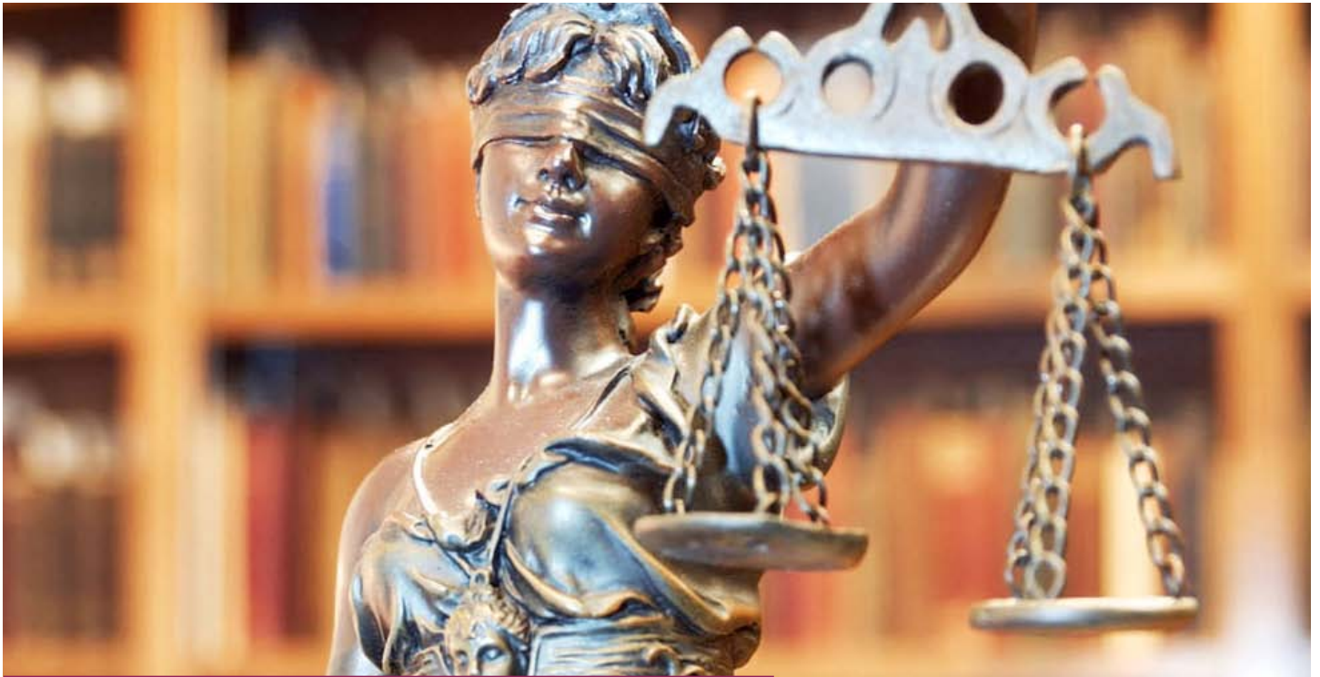
Antická bohyňa spravodlivosti Justícia – má previazané oči, v jednej ruke váhy, v druhej meč a stojí na hadovi. Taká je spravodlivosť – večná, slepá, uvážená, nekompromisná a pokorujúca zločin

jedná o trestný čin – neoprávnené užívanie cudzej veci. Páchateľovi pri tomto trestnom čine spravidla nejde o vec samotnú, ale o úžitok z nej (dopestovaná úroda napríklad). Pozor, súdy v rámci svojej rozhodovacej právomoci už v roku 1964 stanovili, že úmyselné pasenie dobytku na pozemkoch iného nemožno posudzovať ako neoprávnené užívanie cudzej veci. Pri tomto trestnom čine je páchateľom ten, kto sa zmocní cudzej veci malej hodnoty v úmysle prechodne ju užívať alebo kto na cudzom majetku spôsobí malú škodu tým, že neoprávnené vec, ktorá mu bola zverená, prechodne užívá. Najmiernejší trest, ktorý páchateľ a za tento skutok postihne je odňatie slobody až na jeden rok.“