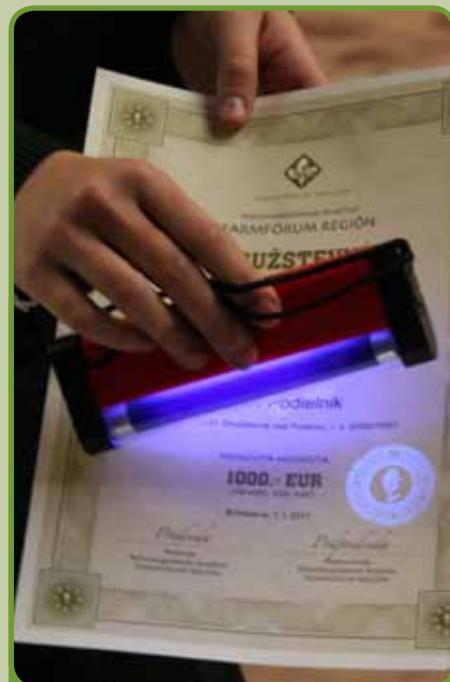
Účastníkom sme názorne ukázali, aké ochranné prvky je vhodné použiť, aby ich DPL nemohli byť sfaľšované.