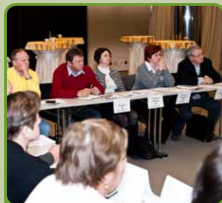
Informácie o zákonných pravidlách zvolávania a priebehu členskej schôdze družstevníkov veľmi zaujali.