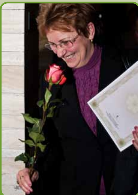
V čase konania podujatia v Košiciach (8.3.), bol Medzinárodný deň žien (MDŽ). Každú z účastných dám potešili páni z LawFarm ružou k ich sviatku.