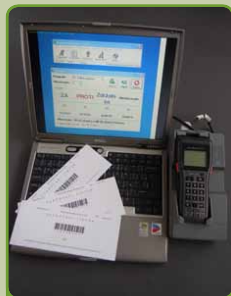
Moderné technické prostriedky LawFarm pre zabezpečenie neverejného hlasovania na členskej schôdzi – špeciálny hlasovací softvér, čítačka čiarových kódov a kódované hlasovacie lístky.

„Zákon ustanovuje, že predstavenstvo družstva umožní každému, kto osvedčí právny záujem, aby do zoznamu členov družstva nahliadol. Zákon nedefinuje, kto musí predmetný zoznam členov viesť. Zákon ustanovuje len to, že predstavenstvo je tým orgánom, ktorý umožňuje akejkoľvek fyzickej alebo právnickej osobe, aby požiadala o nahliadnutie do daného zoznamu. Predstavenstvo