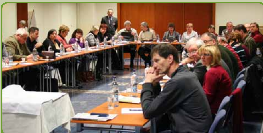
Členská schôdza družstva FARMFÓRUM REGIÓN so sídlom v Banskej Bystrici.

V ďalšom kroku, sme si vysvetlili, ako je možné správne dostať DPL pod kontrolu alebo ich využiť. Ide o dva základné spôsoby. Prvým je realizovať nákup DPL, druhým realizovať ich zánik. Pri objasňovaní prvého spôsobu riešenia, sme nevynechali otázku vlastníctva, darovania DPL Fondu národného majetku, rozdielu medzi hlasovacou a vlastníckou väčšinou v družstve, výhod plynúcich z premeny DPL zo zaknihovaných na listinné alebo informácie o tom, čo sú stanovy družstva a čo by mali obsahovať skôr, ako sa pustíme do riešenia DPL. Zároveň sme účastníkom objasnili i rad tzv. guerillových taktík, ktoré družstvá v snahe o zmenu vnútorných pomerov v