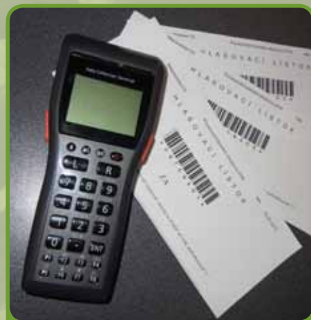
Hlasovanie bolo zabezpečené profesionálne - čítačkou čiarových kódov.