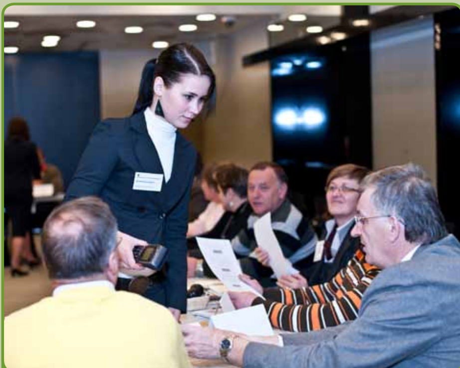
LawFarm má s organizačným zabezpečením členských schôdzí skúsenosti, hlasovanie teda prebehlo hladko.