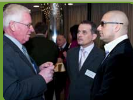
Celý tím LawFarm intenzívne konzultoval s účastníkmi aj počas prestávok.

Po celkovom súhrne dôležitých informácií, ktoré mali účastníci možnosť si vypočuť, pripomenul na záver prednášky hlavný prednášajúci základné hrozby a príležitosti, ktoré v súvislosti s DPL vznikajú. Tým sa ale podujatie neskončilo.