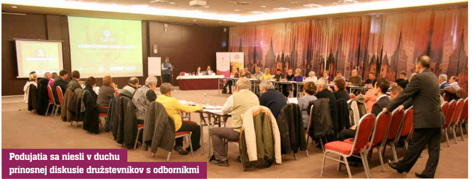
Podujatia sa niesli v duchu prínosnej diskusie družstevníkov s odborníkmi