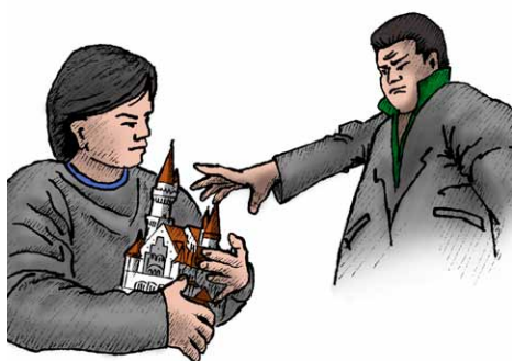
Zodpovedný manažér by mal družstvo chrániť pred nepriateľským prevzatím

Predseda družstva je funkcia a nie orgán družstva. V stanovách musí byť jasne definované, akú kompetenciu majú tie-ktoré orgány družstva. Podľa legislatívy je orgánom družstva členská schôdza, predstavenstvo a kontrolná komisia. Len členská schôdza a nie nejaký osobitný orgán môže rozhodnúť aj o niečom inom, ako jej do kompetencie priznáva zákon. Len členská schôdza si môže vyhradiť do svojej pôsobnosti, alebo do svojho rozhodovania aj otázky, o ktorých za normálnych okolností