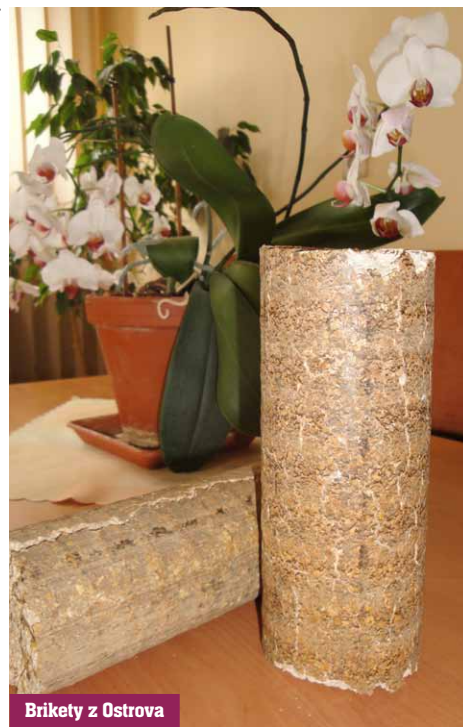
Brikety z Ostrova

A tak šli ruka v ruke dva zámery: posilnenie špecializácie zameranej na produkciu osív