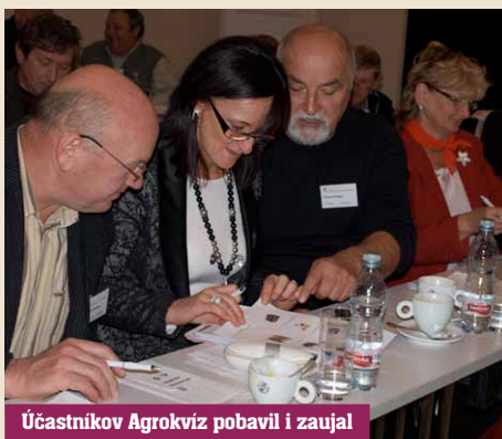
Účastníkov Agrokvíz pobavil i zaujal