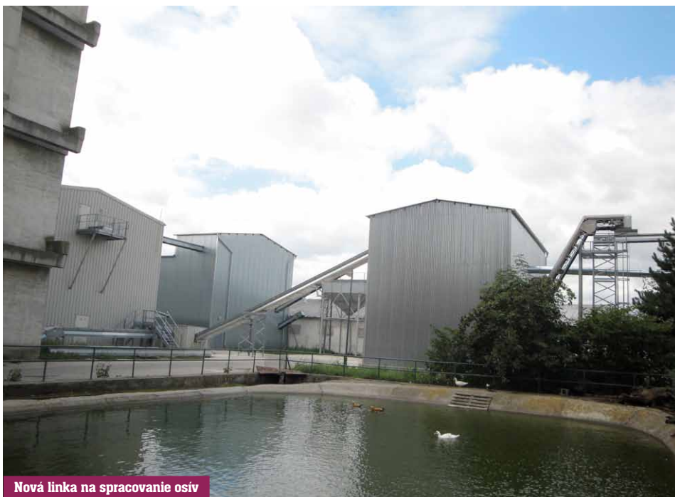
Nová linka na spracovanie osív