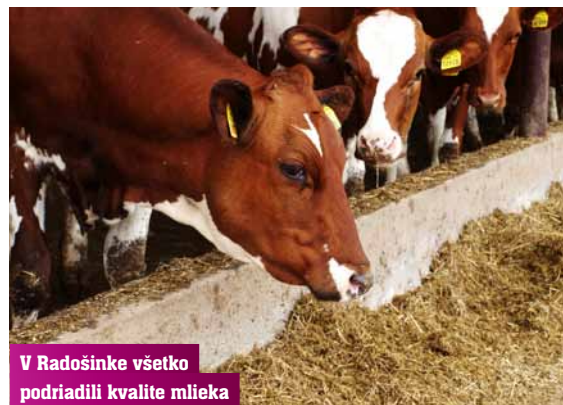
V Radošinke všetko podriadili kvalite mlieka

Majiteľmi pôdy, na ktorej gazdujú, sú právnické osoby (cirkev), štát a fyzické osoby. Družstvo nakupuje od majiteľov pôdy, nakupuje tak vlastne svoj základný výrobný prostriedok, za zvyšnú výmeru platia nájomné. Keď začínali s premenami, nemali peniaze na nejaké veľké nájomné. Požiadali vlastníkov, aby mali strpenie, že keď sa ekonomická situácia zlepší, aj nájomné sa