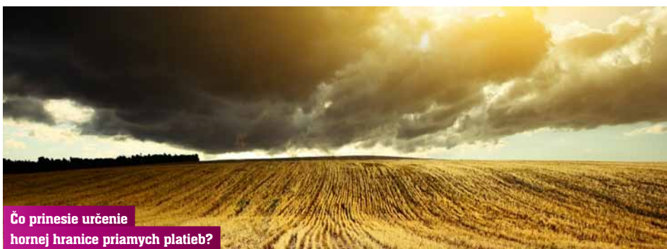
Čo prinesie určenie hornej hranice priamych platieb?

Simulácia dosahov stropovania je založená na produkčno ekonomických údajoch poľnohospodárskych podnikov za rok 2010. Krátenie platieb na jednu farmu v rozmedzí od 150 tisíc do 200 tisíc EUR by sa dotklo 6% podnikov. V rozmedzí 200 až 250 tisíc EUR by krátenie postihlo okolo 4% fariem a v rozmedzí 250 až 300 tisíc EUR by krátenie zasiahlo 3,5% fariem. Napokon by sa krátenie platieb nad 300 tisíc EUR dotklo 10 – 11% fariem. Ak by sa platby v celej EÚ - 27 vyrovnávali až k 1. januáru 2019, tak by stúpalo percento pôdy, dotknutej krátením platieb od 66% v roku 2014 po 74,4 % v roku 2019 a celková suma platieb by bola v roku 2014 nižšia o 57,3 milióna EUR a v roku 2019 až o 91,5 milióna EUR. Tento výpočet neberie do úvahy navrhované odpočítateľné položky, ktorými budú pravdepodobne osobné náklady na zamestnancov a platby pre oblasti s prírodnými obmedzeniami. (prečítate si na str.4. – pozn. redakcie)