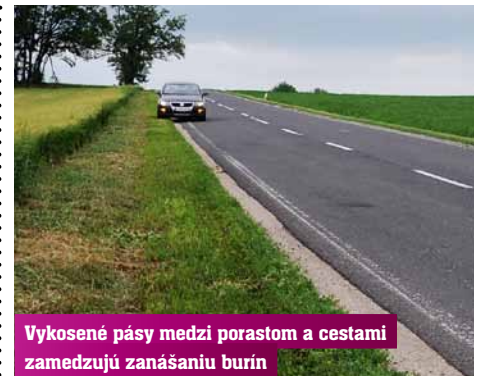
Vykosené pásy medzi porastom a cestami zamedzujú zanášaniam burín