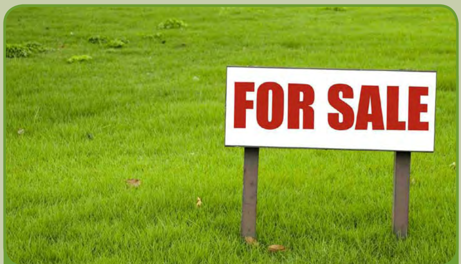
Vyňatie poľnohospodárskej pôdy na stavebné účely by už nemalo byť spoplatnené.

„Zrušenie týchto poplatkov bude mať veľmi pozitívny vplyv na podnikateľské prostredie, pretože jednak sa odstráni tá korupcia a na druhej strane umožní nové investície a vytváranie nových pracovných príležitostí.“ povedal na tlačovej konferencii minister Zsolt Simon. Reagoval tak na negatívne ohlasy zo strany Slovenskej