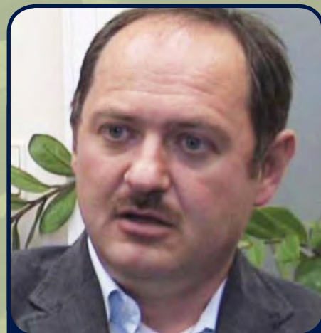
Zsolt Simon, Minister pôdohospodárstva

Zavedením tohto postupu, zbystrili pozornosť opäť družstvá. Podiel na majetku družstiev získava opätovne štát, čo je opakom privatizácie a cestou späť. Družstvám nie je jasné, aký zámer bude mať štát, ako nový vlastník DPL. Družstvám navyše nie je jasné ani to, či zákonodarca nebude chcieť riešiť situáciu novou právnou úpravou, ktorá môže postavenie i práva družstiev a vlastníkov DPL úplne zmeniť.