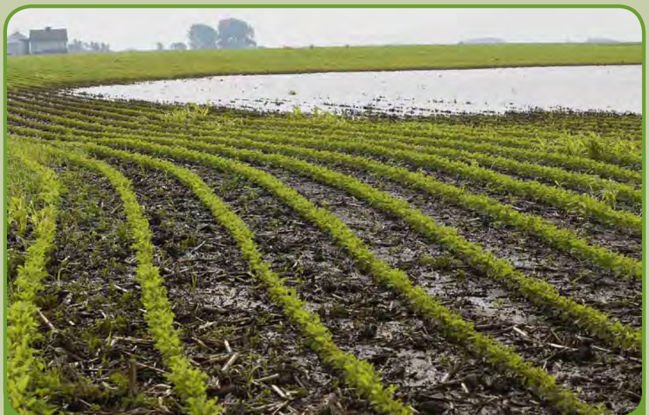
Povodne zasiahli mnohých poľnohospodárov Slovenska. Pomoc sa zide.

Vyplácanie finančných príspevkov pre farmárov bude koordinovať Pôdohospodárska platobná agentúra, no doteraz nie je známy termín, kedy bude zverejnená výzva na predkladanie žiadostí. Podľa hovorkyne ministerstva pôdohospodárstva Kataríny Ďurica, termín bude určený v najbližšom období, očakáva sa, že to bude v mesiaci august. Ako sa však ukázalo, ministerstvo musí najprv nájsť financie, aby mohlo čím skôr pomôcť. „Stále hľadáme riešenie, ako pomôcť poškodeným. Situáciu nám komplikuje nedostatok peňazí v rezorte.