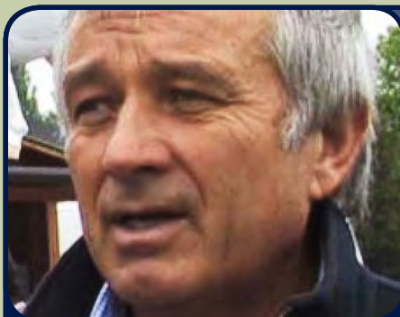
Stanislav Becík, bývalý minister pôdohospodárstva

Na strane družstiev, nie je situácia s DPL o mnoho jednoduchšia. Majetkové podiely vyvolali u družstiev vysoké záväzky, ktorých splatenie by znamenalo krach väčšiny družstiev. Vydanie DPL, ktoré malo tomu zabrániť spôsobilo, že na družstve majú majetkové práva aj osoby, ktoré nie sú jeho členmi, nemajú k nemu vzťah, nemajú motiváciu sa o neho zaujímať. K členom družstiev, ktorých je aktuálne priemerne 170 na jedno družstvo, je tak potrebné prirátava ďalšie stovky osôb de facto vlastníciach časť družstva. Roztrieštenosť vlastníckej štruktúry družstiev spôsobená transformáciou, tak nabrala na obrátkach.