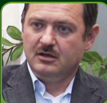
Zsolt Simon, nominant na ministra pôdohospodárstva